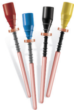
GUTTACORE® do PROTAPER NEXT™

© 2017 Dentsply Sirona, Inc. ST8/B PL PTN 2017 - CREATED 1/2017