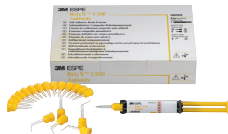
RelyX™ U200 Automix Strzykawka – Odcień A2