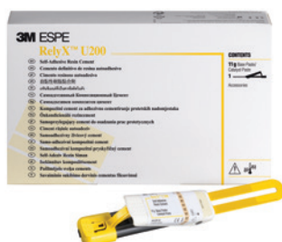
RelyX™ U200 Clicker™ Dozownik – Odcień A2

Opracowany, aby zaspokoić potrzeby Twojej praktyki i Twoich pacjentów!