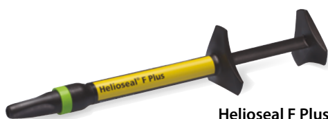
Helioseal F Plus strzykawka 1.25 g cavifil 0.1 g